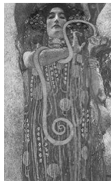
Figura 3. Gustav Klimt, Igea . Dettaglio della Medicina (1900-07), olio su tela; 430 x 300 cm. Bruciato nell'incendio del Castello di Immendorf (1945).

Spiegare il diverso valore di cui viene investito uno stesso elemento nel corso dell'evoluzione e del ripensamento della Storia dell'Arte su se stessa è una questione che tale disciplina si è già posta e che probabilmente continuerà a porsi in futuro. Il montaggio di immagini qui proposto mira ad analizzare uno di questi elementi ripetuti, che si è caricato di significati diversi o addirittura contrastanti nel corso del tempo. È bene sottolineare che avremmo potuto presentare molte più immagini esplicative di questo processo; tuttavia, abbiamo deciso di operare una selezione funzionale ai fini della nostra trattazione.