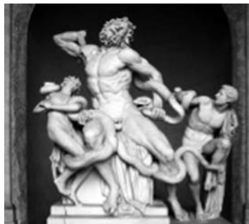
Figura 1. Agesandro, Atanodoro e Polidoro, Laocoonte e i suoi figli , I sec. d.C. Roma, Museo Pio-Clementino.