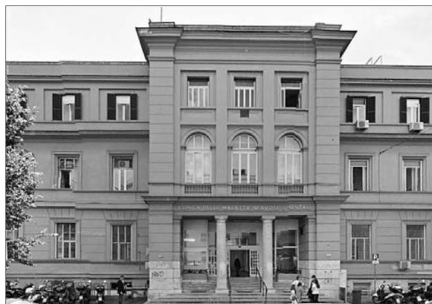
Figura 10. La Clinica Psichiatrica del Policlinico Umberto I come si presenta oggi.

Il nominativo di vari psichiatri del Dipartimento è presente – anche con centinaia di citazioni – nelle banche dati internazionali quali Journal of Citation Report, PubMed, PsycInfo, Excerpta Medica, nonché in diversi volumi di case editrici internazionali. Sulla scia dei maestri, la Scuola continua a esprimere nella ricerca quell’apertura che è problematizzazione vitale, in cui la discussione culturale sostituisce alla timbratura di fissità l’atteggiamento dialettico, in un percorso che, lungi dal considerarsi concluso, è sempre «base di partenza per ogni ulteriore ricerca» 19 .