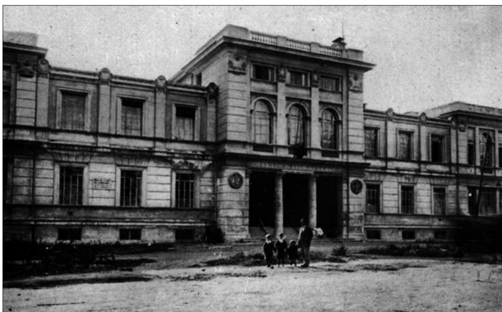
Figura 3. Istituto di Clinica Psichiatrica, in viale dell’Università 30.

Nel 1919, dopo la morte di Augusto Tamburini, viene incaricato all’insegnamento Sante De Sanctis, ordinario di Psicologia. L’anno successivo la disciplina si fonde, per decreto del Ministero, con la Neurologia (Malattie Nervose) nella nuova struttura che prende il nome di Clinica delle Malattie Nervose e Mentali. La cattedra è assegnata a Giovanni Mingazzini, allievo di Todaro, noto per il carisma delle sue lezioni, che conferisce alla Psichiatria una marcata impronta neuropatologica basata sulla grande conoscenza dell’anatomia, dell’anatomia patologica e dell’istopatologia del Sistema Nervoso. Si ricordano i 25.000 preparati in serie di tagli del cervello per la ricerca delle lesioni del Sistema Nervoso. Derivata dalla fusione delle due discipline, la Clinica delle Malattie Nervose e Mentali si trasferisce definitivamente, anche per la par-