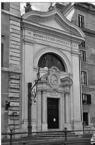
Figura 1. Chiesa dei SS. Bartolomeo e Alessandro dei Bergamaschi, nota anche come Santa Maria della Pietà.

Coccanari de' Fornari MA, Iannitelli A, Biondi M