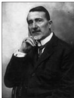
Figura 4. Sante De Sanctis.

Nel 1930 Sante De Sanctis (Figura 4) diventa titolare della Cattedra di Malattie Nervose e Mentali presso la Sapienza e il Policlinico Umberto I. Fra le sue opere più famose nel campo della Psichiatria e della Psicologia ricordiamo "I sogni", "La mimica del pensiero", "L'educazione dei deficienti" e il "Trattato di Psicologia sperimentale".