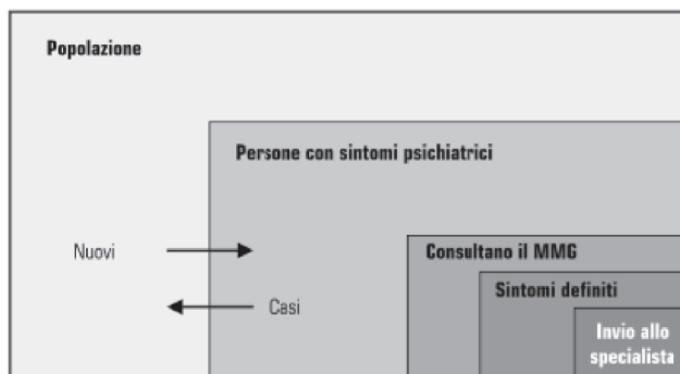
Figura 1. Il modello a cancelli di Goldberg e Huxley.

Questa regione vanta una storia ventennale di programmi strutturati volti all'integrazione tra le cure primarie e i servizi psichiatrici 17 . Nel 1999, su spinta delle politiche sanitarie regionali, nacque il primo programma che inizialmente mirava a riunire tutte quelle esperienze di collaborazione sponta-